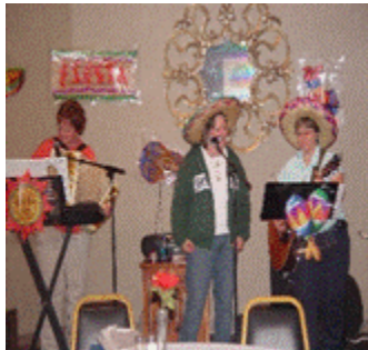
Our Lady of the Snows, Bellville Illinois Oct 2007, Fiesta Music