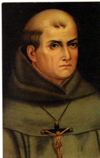
BLESSED JUNIPERO SERRA, PRAY FOR US.

Toda mi vida he querido ser un misionero. He querido llevar el mensaje del Evangelio a aquellos que nunca han escuchado de Dios y el reino que él tiene preparado para ellos. —Bl. Junípero Serra